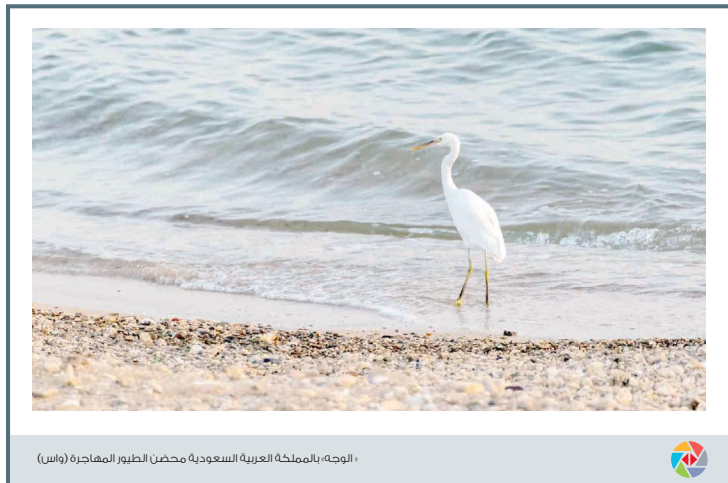
الوجه، بالملكة العربية السعودية محضن الطيور المهاجرة (واس)

حين أرى ما آلت إليه الأمور بالشعب السوري واللبيبي والعراقي واليمنی أسأل إن كان الشعب الفلسطيني هو الشعب العربي الوحيد المتكوب؛ نكبات الشعوب العربية - مع الأسف - تتوالى ولا تتوقف بل تتفاقم، فمن تشرد منهم لا يقلون عدداً ممن تشرد من أبناء الشعب الفلسطيني والعدد قابل للزيادة في ظل تقلب الأوضاع. دك من الأسباب الإسرائيلية كانت أم إيران، لا فرق رغم أن إيران تسببت بتشريد أعداد مضاعفة عما شردته إسرائيل، إنما لنقف عند كم القضايا العربية التي على الدول العربية المستقرة والأمنة والتنمية أن تدعمها، وتأتي على رأسها دول الخليج التي ولله الحمد والمنة «الدولة» فيها كانت ومازالت قوية ثابتة وتؤمن لشعبها الحياة الأمنة المستقرة وخدمات راقية صحية وتعليمية واجتماعية وأمنية، وتؤمن لهم مستوى معيشياً يتراوح بين المعقول والامتياز، وذلك للعلم لا يعود لمواردها الطبيعية التي أنعم الله بها على هذه المنطقة، بل لحسن إدارتها، فليست هناك دولة عربية واحدة لا تتعنت بموارد وبعضها يقوق ما تتمتع به دولة كالبحرين على سبيل المثال، ولكن الاختلاف هو في كيفية إدارة الحكم الرشيد. ورغم ذلك فهي لم تكف بالإلتصاق بمصالحها الخاصة فقط إنما الدول الخليجية كانت ومازالت تؤمن لجميع الشعوب العربية المتكوبة المساعدات المعالية بطريق مباشر أو عن طريق إقامة العديد من تلك العجرات فيها، وتدعمهم سياسياً في جميع المحافل.