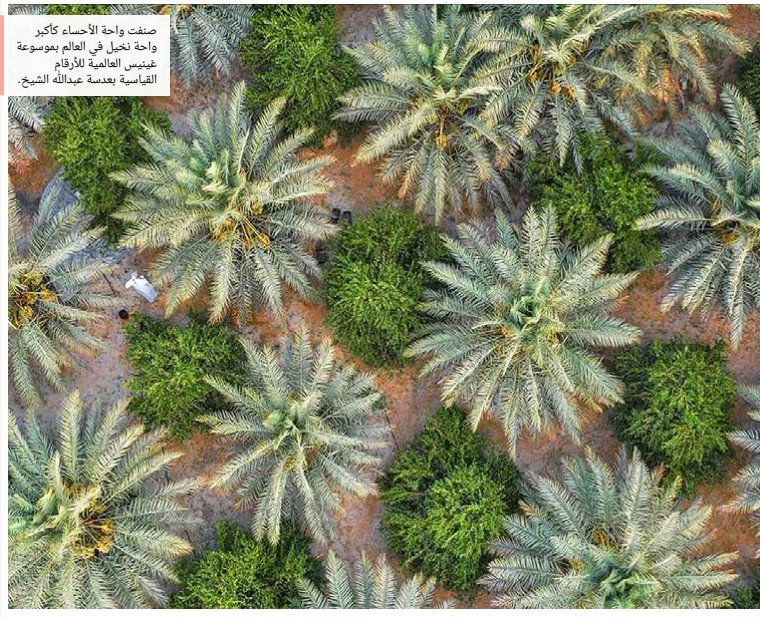
صنفت واحة الأحساء كأكثر واحة نخيل في العالم بموسوعة غينيس العالمية للأرقام القياسية بحمدسة عبدالله الشيخ.

إدارة التحرير: +973 17111444 +973 17111467 +973 385 5 @localalbiladpress.com 2008 - مصر من در البلاد للمصنعة والطبع والتوزيع - ص 67133 طبع في مؤسسة البرم للنشر قسم الإعلانات: 508 / 17111501 +973 32224492 / 39615645 +973 17580939 +973 17111432 +973 17111434